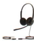
YHS34 Lite Dual