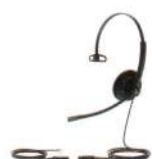
YHS34 Lite Mono

ทางบริษัท ขอสงวนสิทธิ์ในความผิดพลาดอันเนื่องมาจากกระบวนการพิมพ์