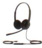
UH34 Lite Dual