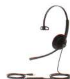
UH34 Lite Mono